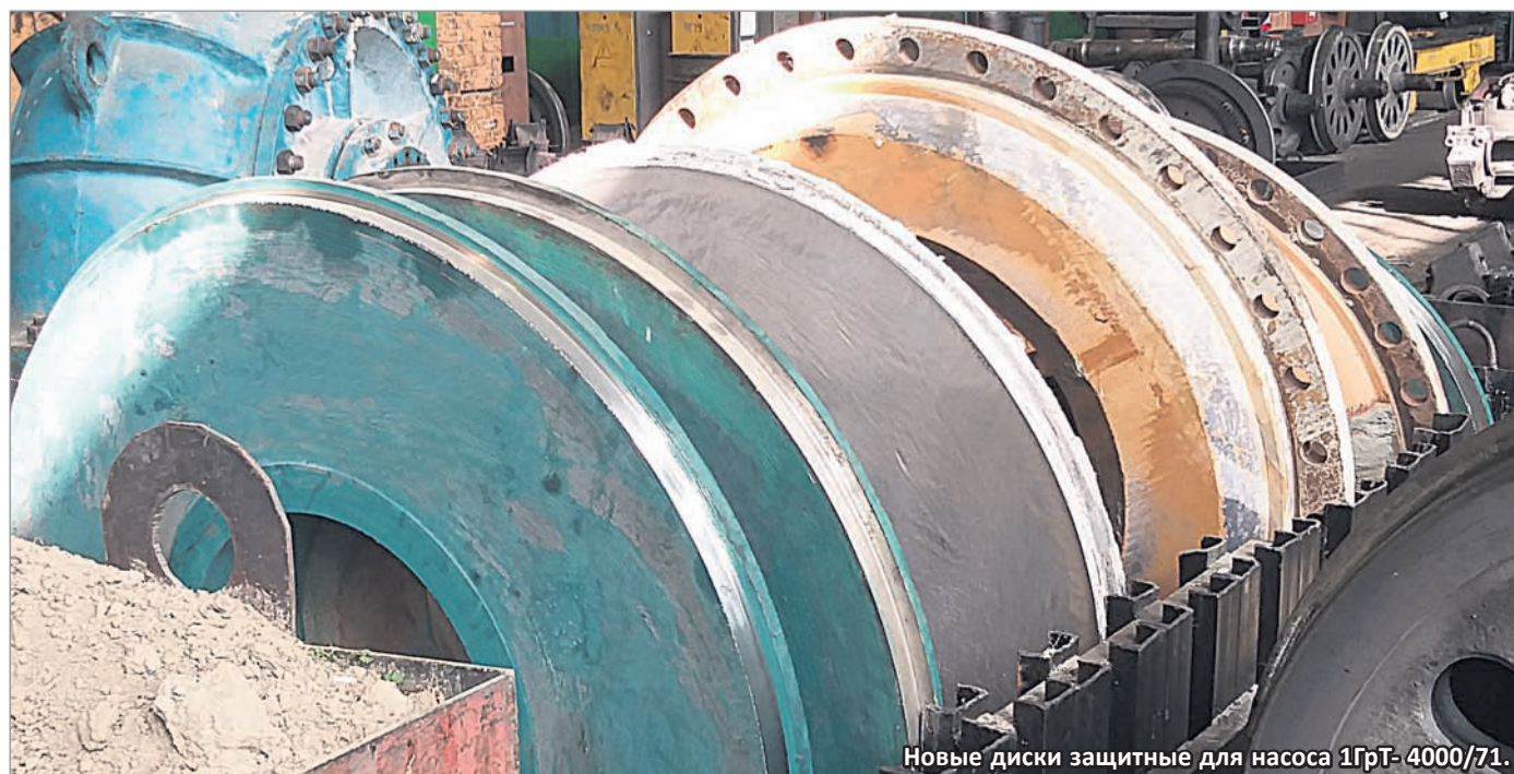
Новые диски защитные для насоса 1ГРТ-4000/71.